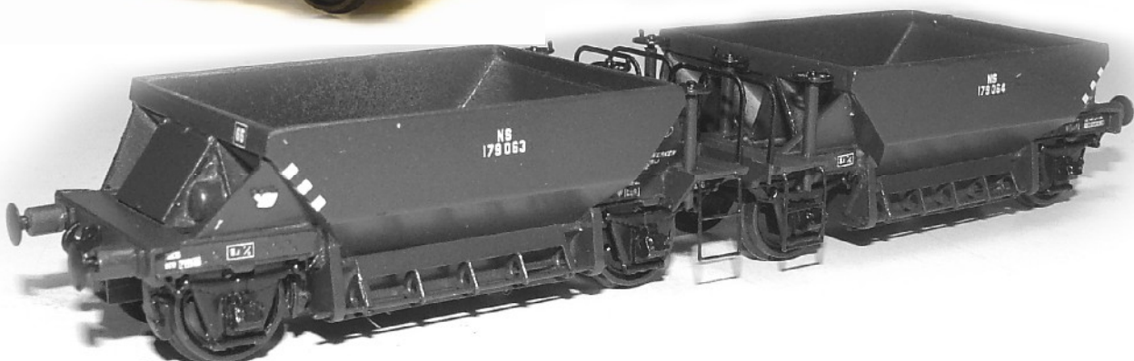
NS kortgekoppelde zelflossers (onder) Kunststof kit met messing details prijs € 32,50 Alleen leverbaar als bouwset