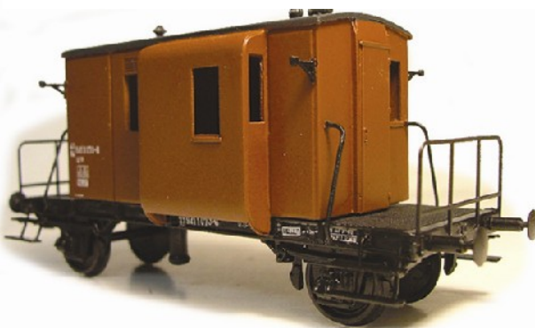
NS Dg conducteurswagen (lnks) Kunststof kit met messing details prijs € 32,50 Alleen leverbaar als bouwset